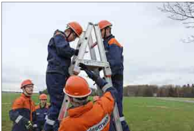
Hand in Hand kommt der Tischtennisball auf einem Löffel über die Bockleiter