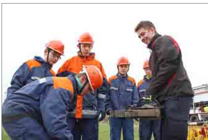
Feingefühl ist gefragt beim Greifen des Tischtennisball mit dem Hydraulikspreizer