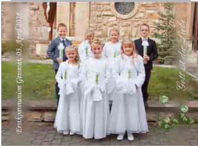
Geismar, im April 2016 Die Kommunionkinder