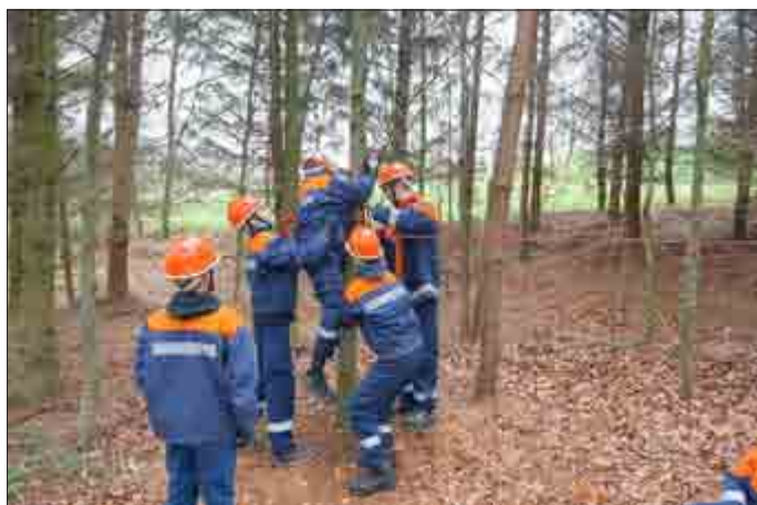
Am Aktionspunkt „Heißer Draht“ muss das Team ein Seil überwinden